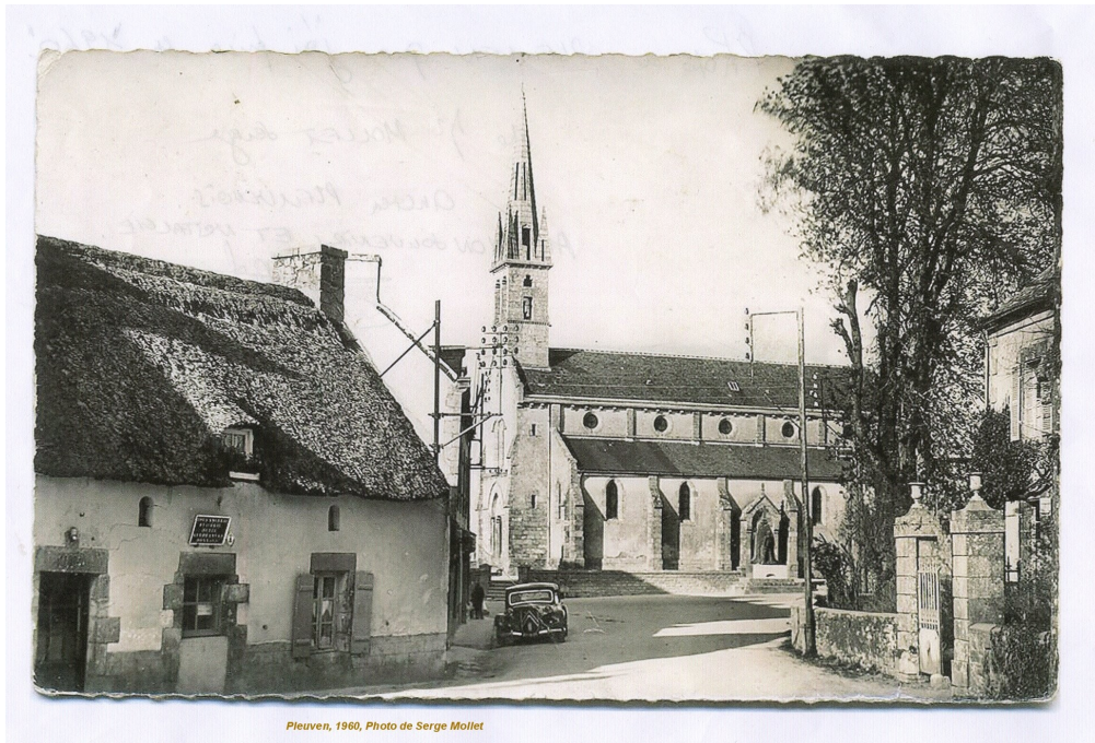
Pleuven, 1960