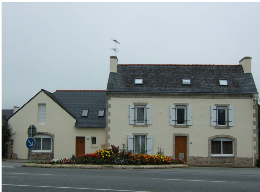
La forge, appartenant toujours à un Louis Le Maout en 2006, transformée en habitation

(L'électrification a débuté vers 1930 pour le bourg, celle des fermes et villages vers 1937 et l'église en 1940).