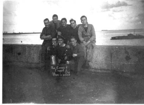
avec des camarades à CHERBOURG

J'ai quitté Cherbourg fin 1938 pour Rochefort, puis direction HyèresS pour la BAN (Base Aéro-Navale) où j'étais affecté comme mécanicien sur les hydravions. Il y avait des Latécoères qui volaient à 200Km /H, des Le Cams qui volaient à 180 Km /H alors que les Messerschmitt allemands volaient à 500 Km/H ;